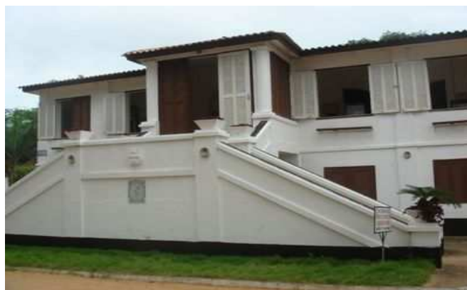
Le fort portugais (actuel musée de Ouidah)