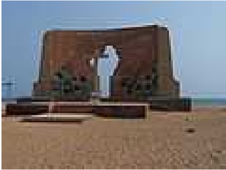
Le monument du jubilé 2000