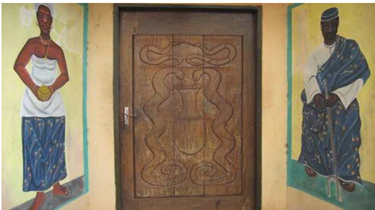
Le temple des pythons