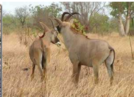
Les animaux de la réserve du Parc de la Pendjari