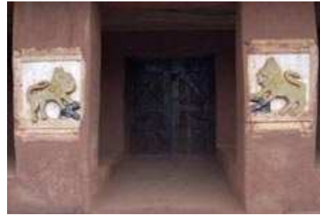
Le musée historique 'Abomey