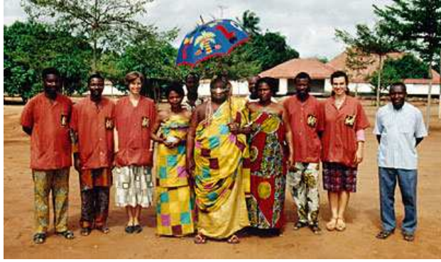
Le roi Agoli-Agbo d'Abomey